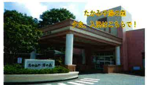
たかみや湯の森 朝食、入浴はこちらで!