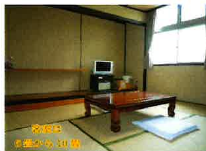
個室 5名様から10名様