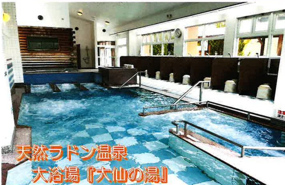
天然ラドン温泉 大浴場「大仙の湯」

注: 30名を超える場合は、布団レンタル料をご負担いただきます。ご了承ください。