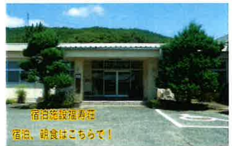
宿泊施設福寿荘 宿泊、朝食はこちらで!