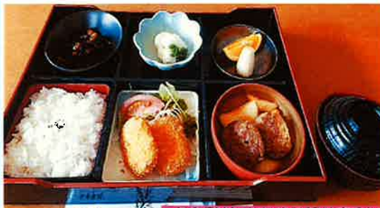
夕食例(おまかせ日替り定食)